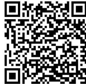
Human Rights Due Diligence Handbook for Small and Medium-Sized Enterprises