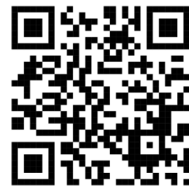
Human Rights Due Diligence: An Interpretive Guide