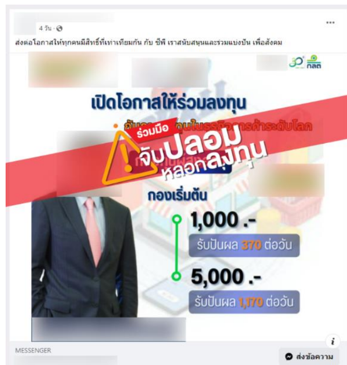
ตัวอย่าง โฆษณาหลอกลงทุนในกองทุนผู้สูงอายุแอบอ้างโลโก้ ก.ล.ต.

สิ่งที่ต้องรู้ คือ ก.ล.ต. และผู้บริหาร ก.ล.ต. ไม่มีนโยบายชักชวนลงทุนรายผลิตภัณฑ์ใด ๆ แน่แน่นอน หากพบเห็นการชักชวนลงทุน หรือใบหุ้นเด็ด หรือแอดไลน์ส่วนตัว ให้รู้ไว้เลยว่า “หลอกหลวง!”