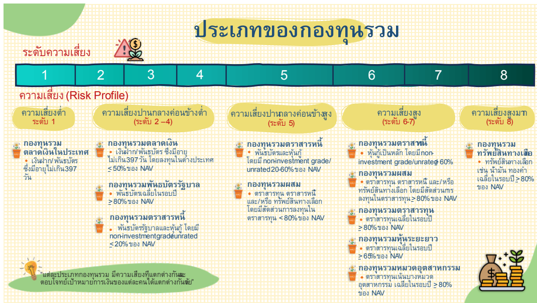
ประเภทกองทุนรวมที่แบ่งตามระดับความเสี่ยง 8 ระดับและ Risk Profile ของผู้ลงทุน

กองทุนรวมที่เสนอขายในประเทศไทย มีการแบ่งตามระดับความเสี่ยงกองทุนรวม เป็น 8 ระดับ ตามประเภททรัพย์สินที่กองทุนรวมเน้นลงทุน ซึ่งนำมาใช้ประเมินร่วมกับการยอมรับความเสี่ยงของผู้ลงทุน (Risk Profile) ที่มี 5 กลุ่ม เพื่อให้ผู้ลงทุนสามารถเลือกกองทุนรวมที่เหมาะสมกับ Risk Profile หรือเป้าหมายการเงินของตัวเองได้